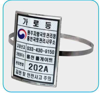
130mm x 180mm