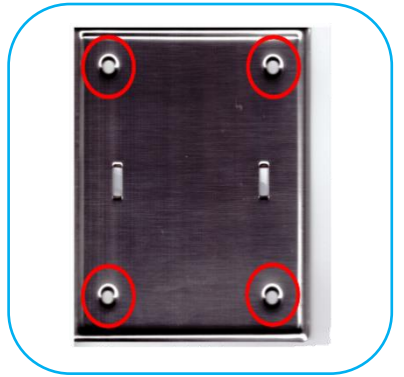
직결사라피스를 사용하여 방음벽에 설치