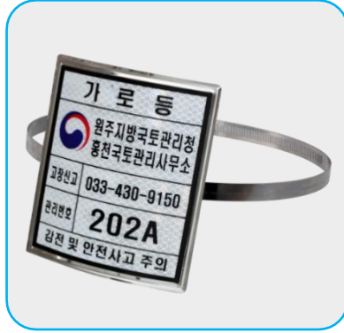
130mm x 150mm